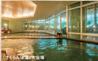
「さくらんぼ湯」大浴場