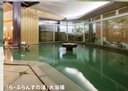
「ら・ふらんすの湯」大浴場