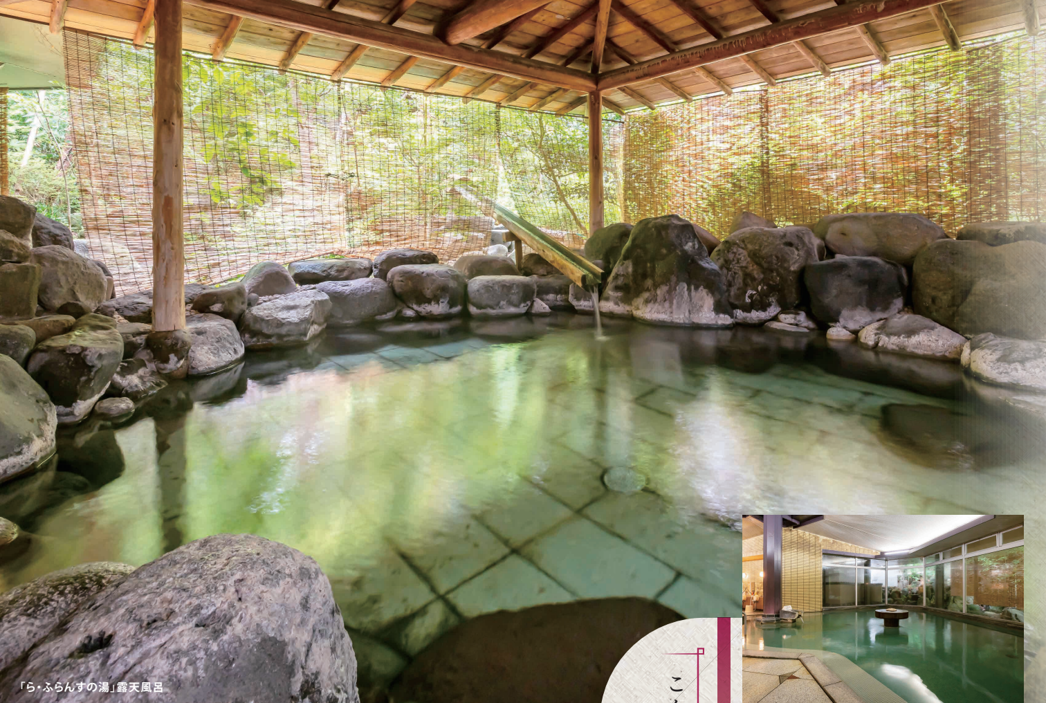
「ら・ふらんすの湯」露天風呂