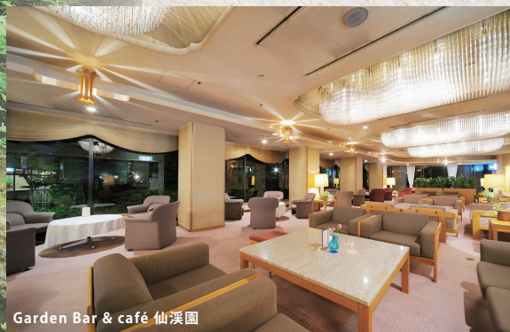
Garden Bar & café 仙溪園