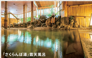
「さくらんぼ湯」露天風呂

古くから「出羽山楽郷」に数えられる名湯です。約五百年余り、ゆつくりと受け継いだ私たちの真心と、癒しのお湯で皆様をお迎え致します。